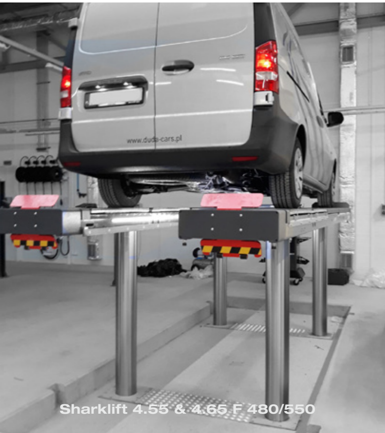
Sharklift 4.55 & 4.65 F 480/550