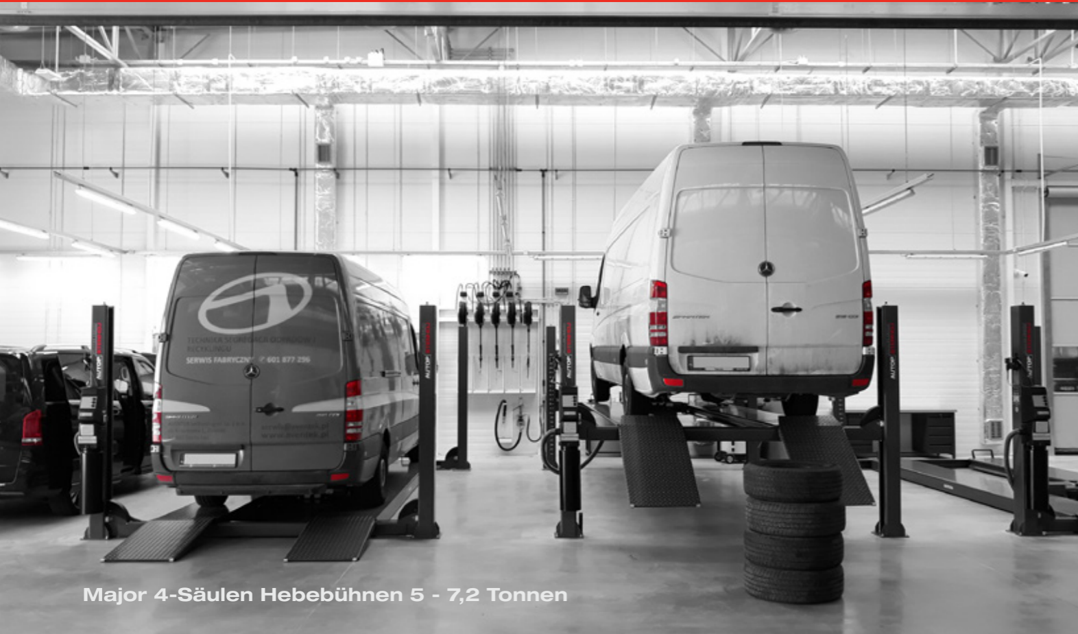
Major 4-Säulen Hebebühnen 5 - 7,2 Tonnen