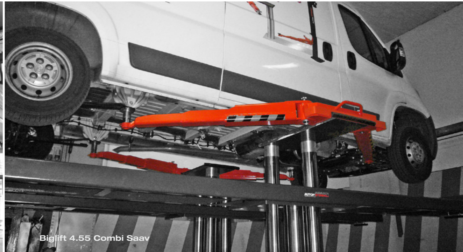
Biglift 4.55 Combi Saav