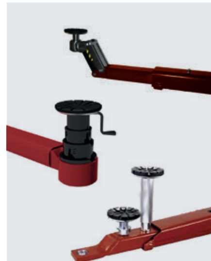
CF-Aufnahme / CF-08 Aufnahme / F-Aufnahme