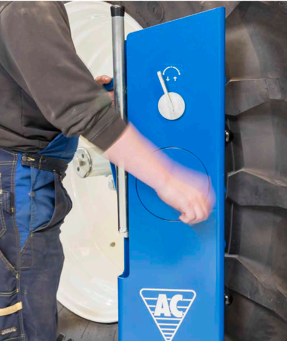
Beim Wiedereinbau kann man die Räder zur perfekten Ausrichtung der Radbolzen drehen.