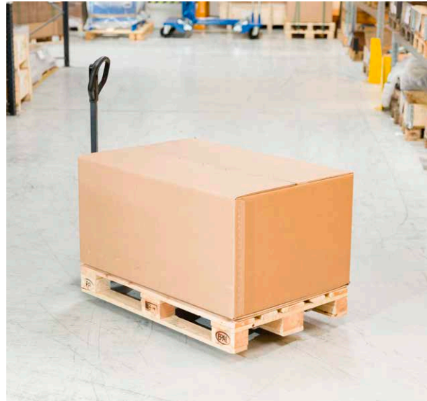
Optimale Verpackung zur Erleichterung der Lieferung und zur Senkung der Frachtkosten