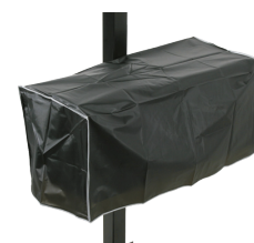
Staubschutzhaube Art.-Nr. 025010051 (bei 2066/L1SA inkl.)