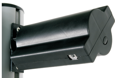
Paralleleinstellung mittels Laser (optional). Art.-Nr. 023010024.